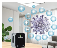
離子結構破壞病毒源結構