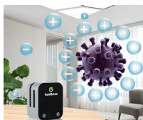
主動吸附和結合 過氧化氫 (H 2 ) 和 氫氧基 (-OH) 形成強力的離子結構 (Ion cluster) 並包圍有害的污染物