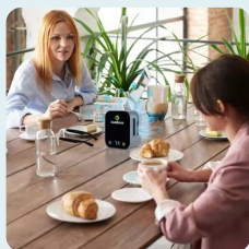
快速消除屋內及車內異味