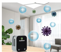
持續釋放離子 Monitair 雙極離子設計利用強大的離子針尖電離系 (Corona Discharge System) 釋放出正電和負電的氧離子